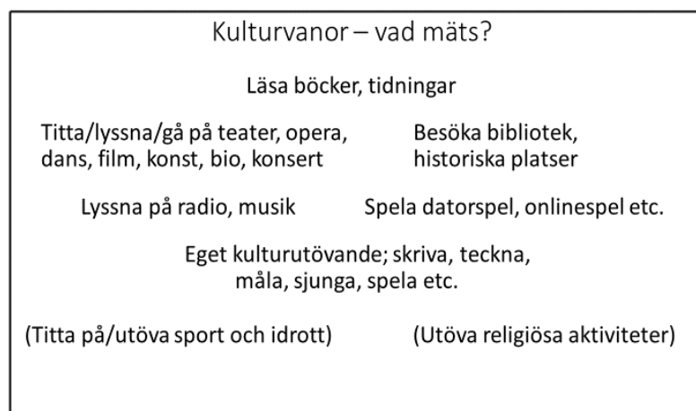
Figur 1. Sammanställning av vad kulturvaneformulären ställer frågor om.

Genomgången av de utförda undersökningarna har visat att kultur indirekt definierats på ett visst sätt. 32 Det kan vara värt att kort granska denna definition. Trots variationen som finns i formulären mäts i huvudsak samma fenomen. I figuren nedan sammanfattas det man frågat efter i de nordiska studierna.